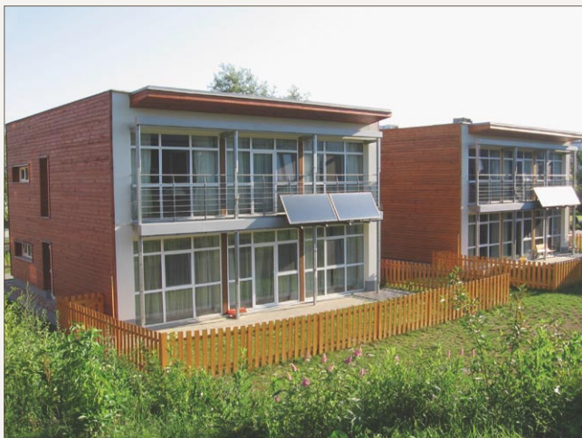
Nízkoenergetické domky dětské vesničky SOS v Brně-Medlánkách

Historie naší vesničky je velmi dlouhá a složitá – první pokus o zahájení její výstavby sahá až na přelom šedesátých a sedmdesátých let. Výstavbu se tehdy díky nástupu „normalizace“ nezdařilo realizovat, přestože se prostřednictvím sbírky podařilo shromáždit dostatek peněz. Skutečná výstavba naší vesničky byla zahájena až v létě roku 2002 a přibližně o rok později prošlo deset rodinných domů a administrativní budova kolaudací. Velmi krátce poté se na konci srpna 2003 do vesničky nastěhovali první obyvatelé – matka-pěstounka a tříčlenná sourozenecká skupina. Zároveň se začínal formovat i odborný tým vesničky – pedagog, psycholog, sociální pracovníce. Do vesničky průběžně přicházely další matky-pěstounky a děti, probíhalo tu několik přípravných kurzů pro budoucí pěstounky, dosud prázdné domky byly využívány pro mezinárodní semináře naší organizace. Na konci roku 2004 žilo v 7 rodinách 21 dětí a během následujícího půl roku se počet dětí zdvojnásobil. Nyní – v létě 2005 – máme 10 rodin a 42 dětí, všechny domy jsou obsazeny a do rodin budou postupně přicházet další děti, dokud nedosáhneme naplnění naší kapacity – 60 dětí.