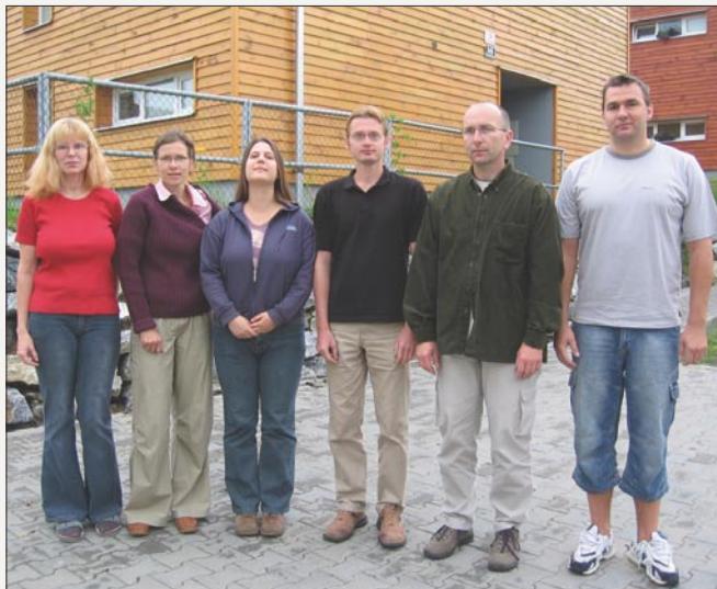
Odborný tým SOS DV